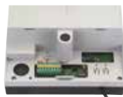
Motorsturing E700 HS (ingebouwd) Zie pag. 174